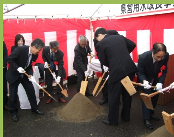
そして起工式のハイライト「鍬入れ」 来賓の方々も加わり エイ！エイ！エイ！ 工事の安全と地域の発展を祈願しました