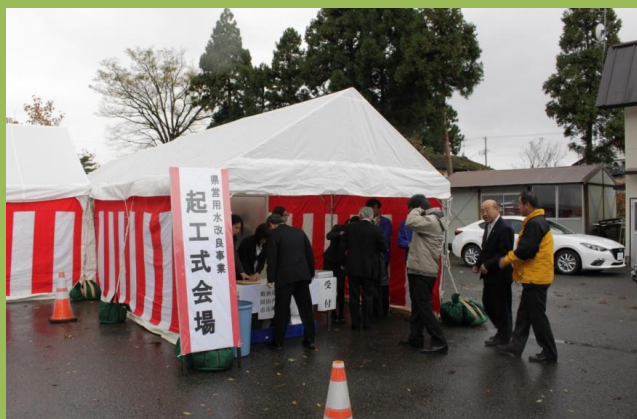
県営用水改良事業(上堰・八力村堰, 上堰下流地区)の 起工式が庄内町狩川地内にて挙行されました