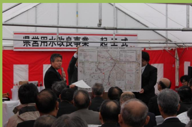
事業の概要を説明