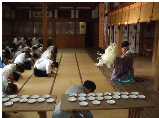
関係者総勢62名が出席し、神社社殿にて厳かに祭典が執り行われました。