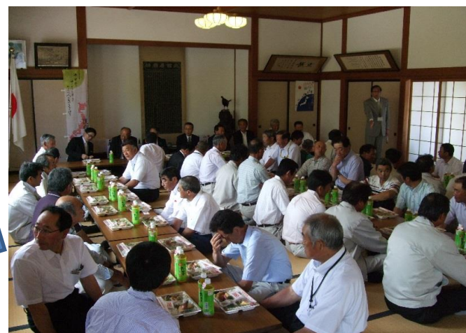
祭典終了後は、開削功労者の偉業と功績に思いを馳せながら、直会(昼食会)が開かれました。