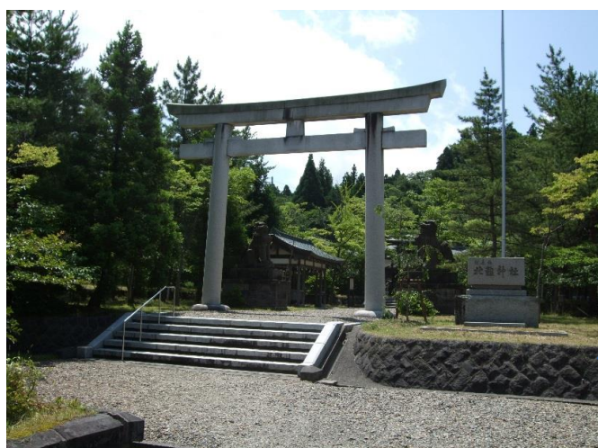
祭典が行われた北館神社

去る6月9日に、北楯・吉田堰開削功労者顕彰感謝祭が庄内町狩川の北館神社にて執り行われました。本祭は、北楯大堰と吉田堰の開削功労者である「北館大学利長公と佐々木彦作翁」をはじめ、両堰の開削事業に携わった先人達の偉業・功績に感謝し、それを後世に伝えるべく毎年行われております。